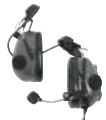
RMN4053 – Zestaw podhełmowy z pasywnymi ochronnikami słuchu (kolor szary)