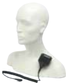
HMN9030 – Mikrofonogłośnik