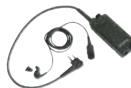
BDN6646 – Indukcyjny zestaw słuchawkowy z przyciskiem PTT