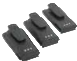
Akumulatory Li Ion, NiCd i NiMH