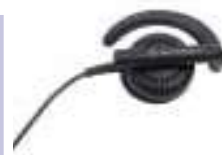
BDN6720 – Elastyczny odbiornik douszny

64-Kanałowy radiotelefon, z 8-znakowym, podświetlanym wyświetlaczem oraz 10 ikonami, przeznaczony dla kierownictwa i pracowników większej firmy. Pełna, odpowiednio skonfigurowana klawiatura umożliwia natychmiastowe połączenia indywidualne lub wywołanie grupowe, zapewniając jednocześnie dostęp do menu i listy kontaktów, spełniającej funkcję książki telefonicznej. Użytkownik – dzięki funkcji wyświetlenia – ma możliwość natychmiastowej identyfikacji wywołującego. Blokada klawiatury