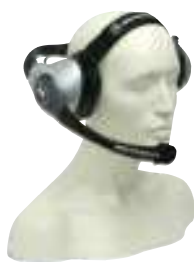
RMN5015 – Ciężki zestaw nagłowny (wymaga użycia kabla z adaptorem RKN4090)