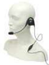
MDPMLN4444 – MAG ONE Zestaw słuchawkowy z przyciskiem PTT/VOX na kablu